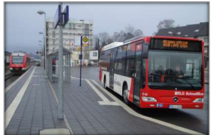
Neuer Bahnhof Brilon Januar 2013