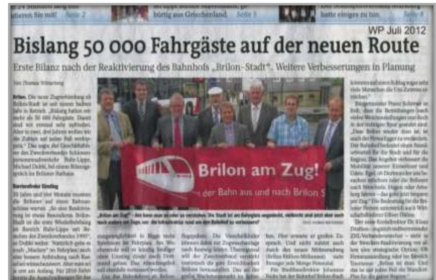
Halbjahresbilanz Mitte 2012

Ergänzend wurden im Umfeld 2 weitere Kaufverträge mit privaten Erwerbern abgeschlossen, die zur Umsetzung ihrer Planungen – Umgestaltung des Güterschuppenareals und Neubau einer Büroimmobilie – ebenfalls Flächen benötigten.