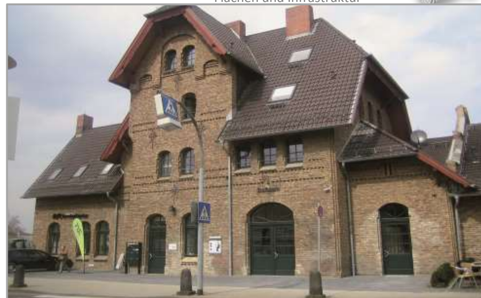
Außenansicht nach Sanierung und Entwicklung

Somit wurde die Modernisierungsoffensive vollständig ausgeführt. Gegenwärtig dauern Baumaßnahmen zur Errichtung eines Bahnsteigdaches an, welches voraussichtlich zum Herbst/Winter 2015 fertig gestellt werden soll. Zu dieser Zeit soll auch der hintere Teil des Bahnhofsgeländes (Keramikerstraße) verkehrstechnisch überplant werden. Voraussichtlich sollen weitere Parkplätze und ein Konzept zur Verbreiterung des Fahrradweges entstehen.