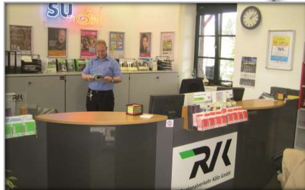
Innenansicht nach der Sanierung und Entwicklung