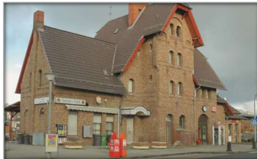
Außenansicht vor Sanierung und Entwicklung