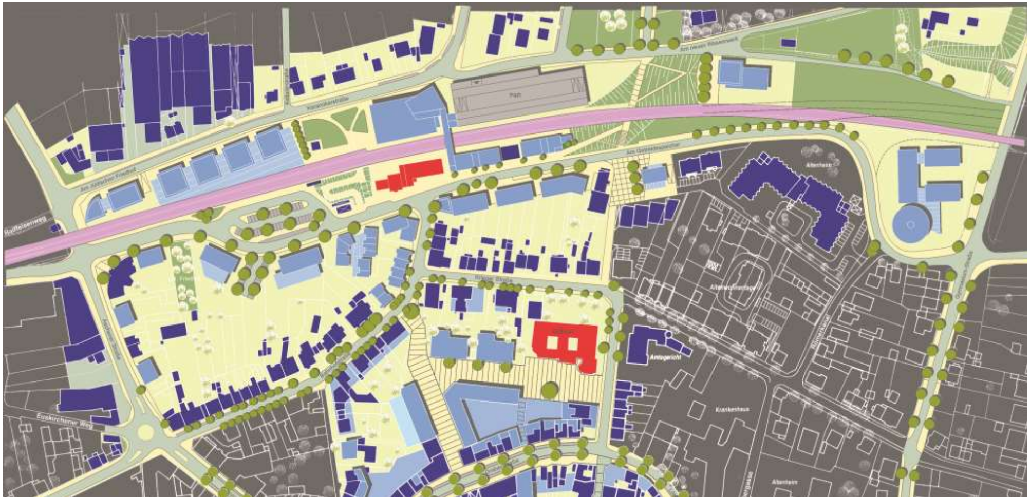
Entwicklungsplan für das Bahnhofsquartier in Rheinbach