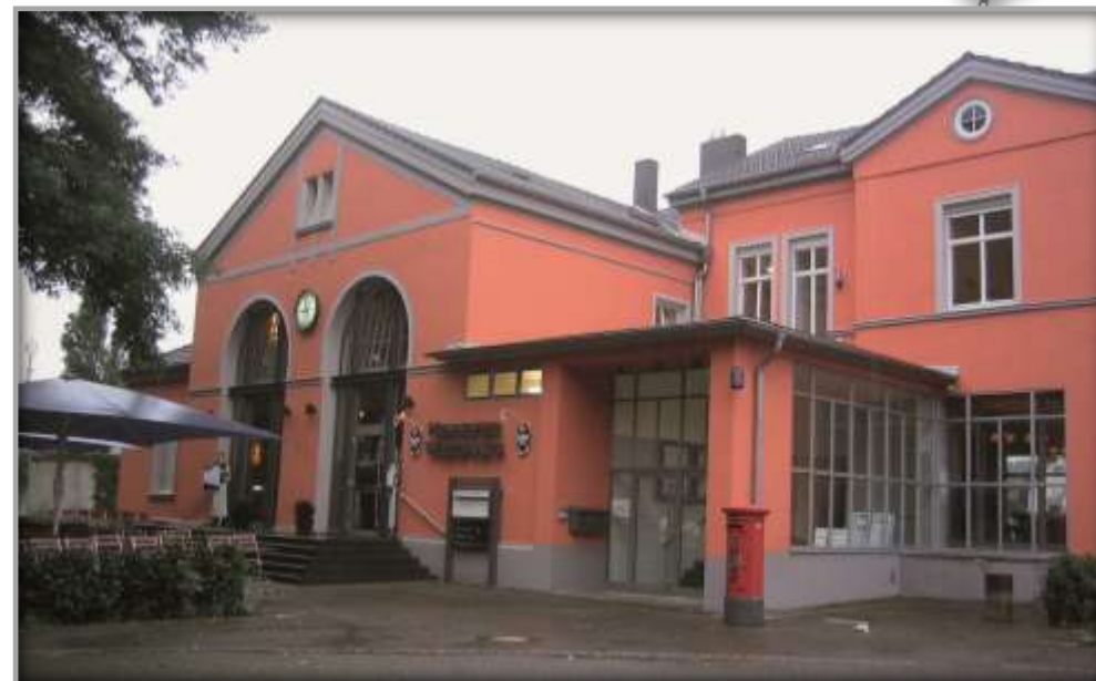
Empfangsgebäude nach der Sanierung

Nach dem Ankauf des Empfangsgebäudes durch die ALIA Bahnhof GbR 2005, begannen ein Jahr später die Sanierungsarbeiten. Das Gebäude wurde entkernt und die historische Fassade durch den Einbau von Bogenfenstern wiederhergestellt. Sowohl Dach als auch der Außenputz wurden erneuert. Durch den neuen Grundriss im westlichen Gebäudeteil entstand ein neuer Durchgang vom Vorplatz zum Bahnsteig sowie zur privaten Fahrkartenagentur und einem Schnellrestaurant.