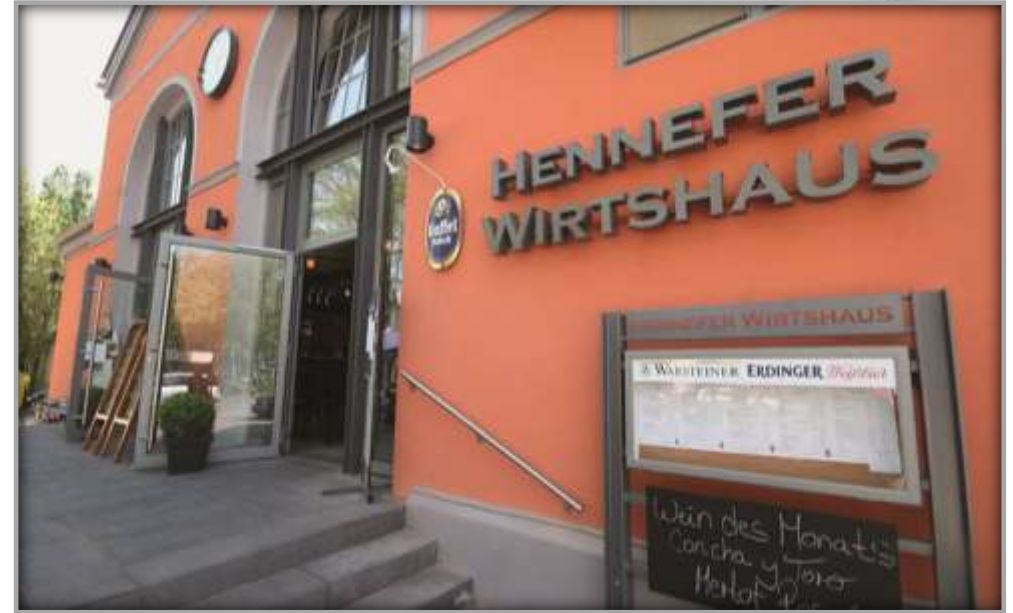
Hennefer Wirtshaus nach der Entwicklung