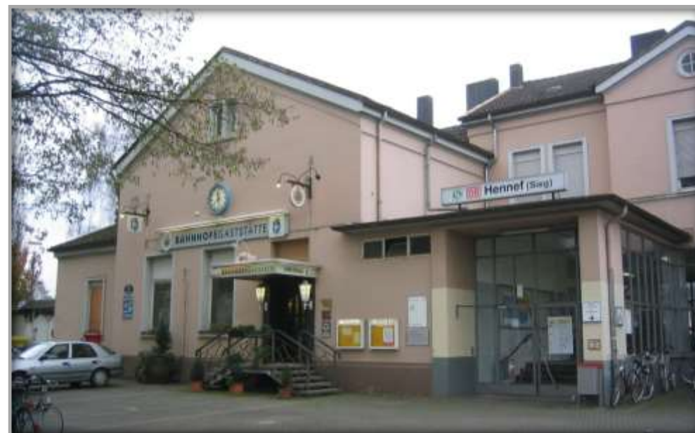
Empfangsgebäude vor der Sanierung

Auch die Bahnbrachen im Bahnhofsumfeld wurden entwickelt. Gemeinsam mit der BEG hat die Stadt den Bau eines Fachmarktzentrums realisiert.