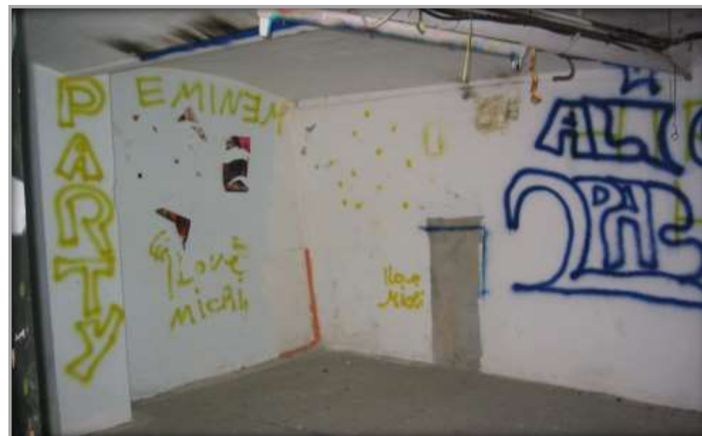
Innenansicht vor der Sanierung und Entwicklung