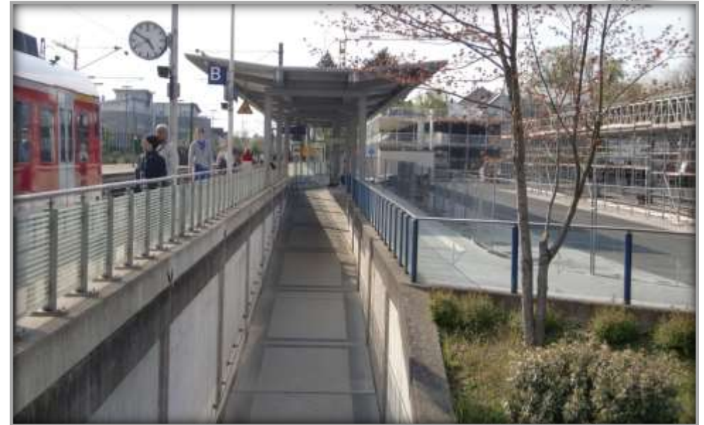
Bahngleis nach der Sanierung