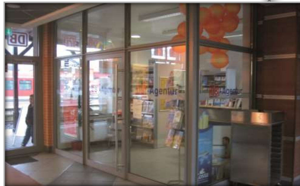
Innenansicht nach der Sanierung und Entwicklung