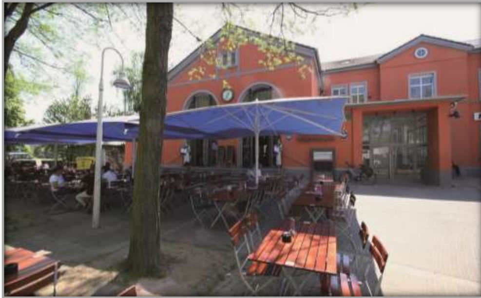
Terrasse des Wirtshauses nach der Entwicklung