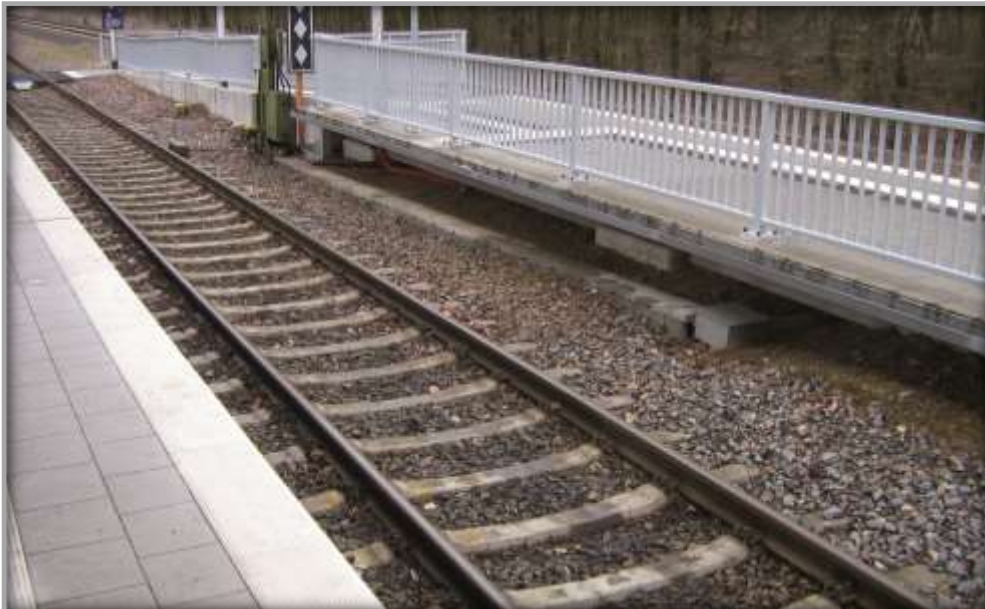
Bahnsteige nach der Entwicklung