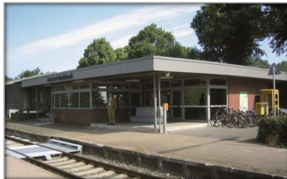
Empfangsgebäude und Bahnsteig vor der Entwicklung