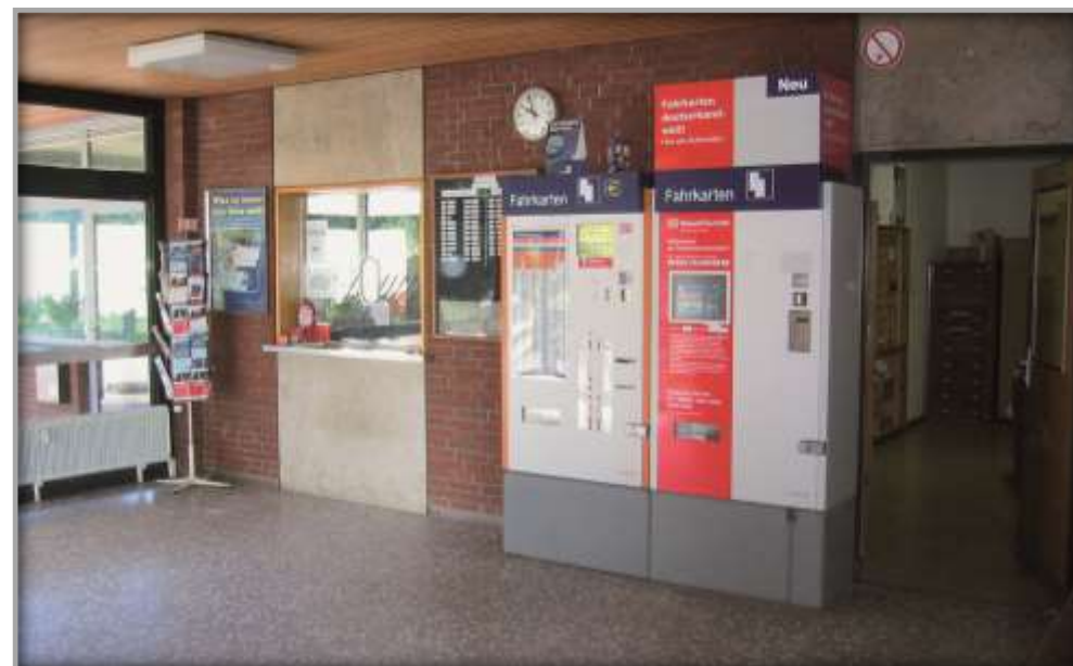
Eingangshalle des Empfangsgebäudes