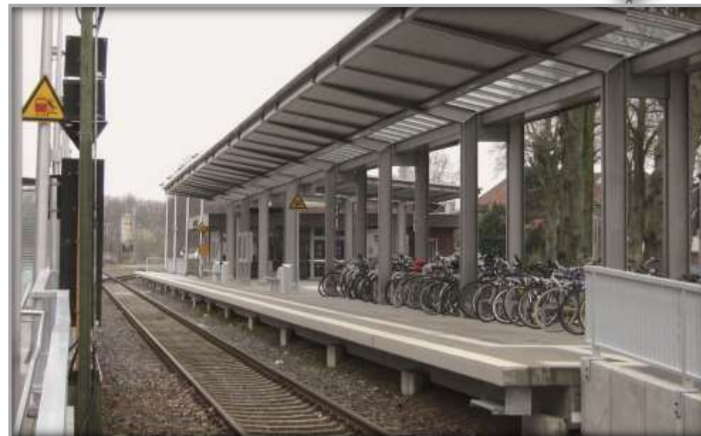
Bahnsteig nach der Entwicklung

Das Bahnhofsgebäude wurde in seiner Gestaltung und Funktion zunächst belassen. Mit der DB Netz AG schloss die Gemeinde einen Mietvertrag über die Räume des Stellwerks und des Fahrkartenschalters. Die Wartehalle wird von der Gemeinde betrieben. Der Ankauf des Bahnhofsgebäudes ist auch mit Blick auf die langfristige Perspektive. Nachdem die Realisierung des elektronischen Stellwerks auf der Strecke umgesetzt wurde, hat die DB Netz AG das alte mechanische Stellwerk und den Fahrkartenverkauf aufgeben, so dass die Gemeinde dann eine Umgestaltung und Neunutzung des Gebäudes nach ihren Zielen vornehmen kann.