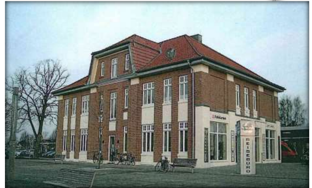
Außenansicht nach der Entwicklung

Ende der 90er Jahre wurde seitens der Stadt Gronau ein städtebauliches und verkehrliches Gesamtkonzept für die Bahnhofsumfeldentwicklung entworfen. Anschließend erfolgte 2003 im Rahmen der Maßnahmen für die Landesgartenschau eine umfassende Neugestaltung des Bahnhofsvorplatzes. Hierbei ist neben dem Bahnhofsgebäude eine RadStation mit einem angegliederten Kiosk und Informationsbüro entstanden. Der Gronauer Bahnhof hat insgesamt durch die umfangreichen Umbaumaßnahmen eine neue Verkehrsführung erhalten und wurde barrierefrei gestaltet. Zudem wurde das Bahnhofsumfeld aufgewertet, sodass der Bahnhof 2010 eröffnet wurde. Die Ziele, eine barrierefreie Gestaltung, eine neue Verkehrsführung sowie die zweckmäßige Verknüpfung verschiedener Verkehrsträger als auch die Aufwertung des Bahnhofsumfeldes wurden somit erreicht.