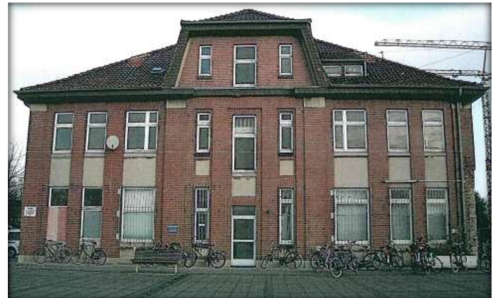
Außenansicht vor der Entwicklung

Ende der 90er Jahre wurde seitens der Stadt Gronau ein städtebauliches und verkehrliches Gesamtkonzept für die Bahnhofsumfeldentwicklung entworfen. Anschließend erfolgte 2003 im Rahmen der Maßnahmen für die Landesgartenschau eine umfassende Neugestaltung des Bahnhofsvorplatzes. Hierbei ist neben dem Bahnhofsgebäude eine RadStation mit einem angegliederten Kiosk und Informationsbüro entstanden. Der Gronauer Bahnhof hat insgesamt durch die umfangreichen Umbaumaßnahmen eine neue Verkehrsführung erhalten und wurde barrierefrei gestaltet. Zudem wurde das Bahnhofsumfeld aufgewertet, sodass der Bahnhof 2010 eröffnet wurde. Die Ziele, eine barrierefreie Gestaltung, eine neue Verkehrsführung sowie die zweckmäßige Verknüpfung verschiedener Verkehrsträger als auch die Aufwertung des Bahnhofsumfeldes wurden somit erreicht.