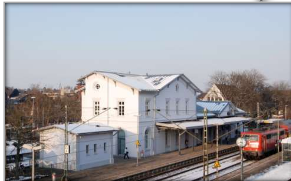
Außenansicht nach der Veräußerung und Entwicklung

Nach dem Erwerb des Empfangsgebäudes 2008, begann die Stadt Geilenkirchen mit der Sanierung des Gebäudes. Das Empfangsgebäude wurde energetisch saniert, dabei war auch die Herausstellung des Gründerzeitcharakters ein wichtiges Ziel.