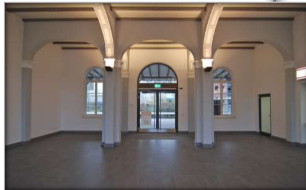
Innenansicht nach Sanierung und Entwicklung