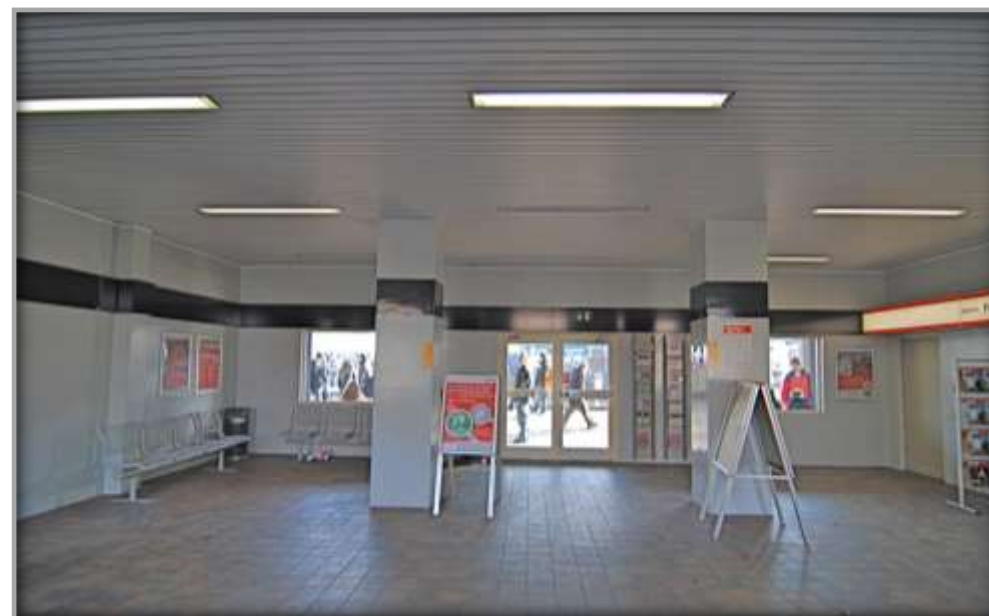
Innenansicht vor Sanierung und Entwicklung