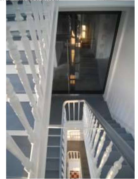
Treppenhaus nach der Sanierung