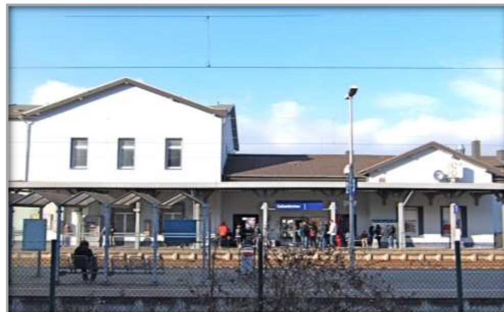
Außenansicht vor der Veräußerung und Entwicklung

Die Flächen im Empfangsgebäude wurden neu aufgeteilt, sodass sich heute im Erdgeschoss neben der Empfangshalle eine Bäckerei mit Außenterrasse, ein Schnellrestaurant, sowie das DB Reisezentrum befinden. Das Obergeschoss ist durch Büroflächen genutzt. Alle Flächen im Erdgeschoss sind barrierefrei gestaltet. Mittelfristig plant die Stadt die Modernisierung des Vorplatzes und des ZOB.