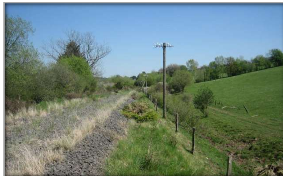
Vorher: Schotterbett, Gleise bereits abgebaut am BF Losheim.