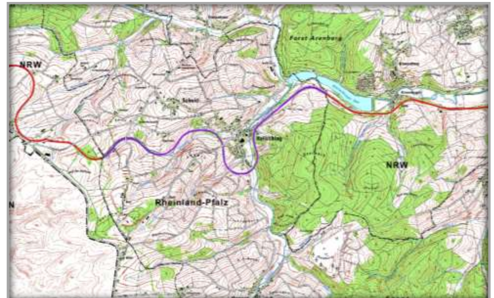
Bundesländerübergreifende Entwicklung der Strecke zu einem Radweg.

Abstimmung und Bau erfolgten bundesländerübergreifend. Im Zuge dieser länderübergreifenden Planung mussten unterschiedliche baurechtliche und förderrechtliche Fragen sowie abweichende Arten der Landschaftspflege in NRW und RLP aufeinander abgestimmt werden.