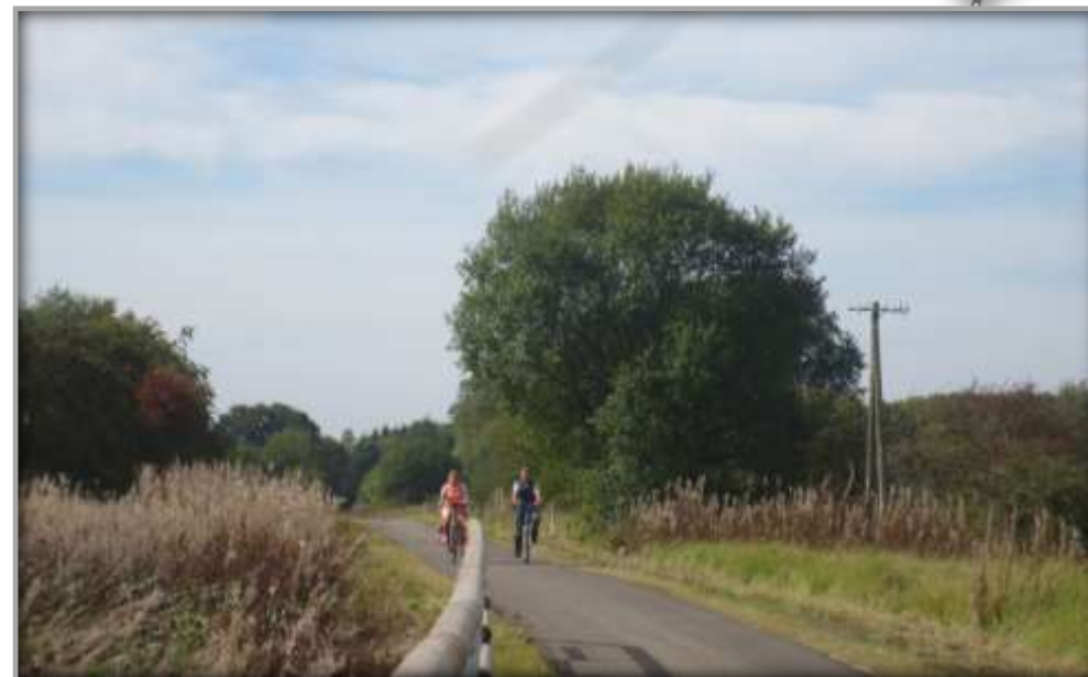
Nachher: Stark frequentierter Radweg am BF Losheim