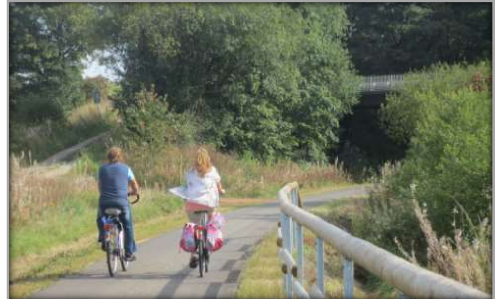
Streckenabschnitt am ehemaligen BF Losheim.

Der Streckenabschnitt 3003 befindet sich in der Eifel, nahe der belgischen Grenze, zwischen Malmedy, Monschau und Blankenheim. Die Strecke verläuft über zwei Bundesländer (NRW und RLP) bis zur Staatsgrenze nach Belgien entlang der Bundesstraßen 265 und 421. An der Landesgrenze besteht Anschluss an das belgische Radwegenetz. Der neu entstandene Radweg ist ebenfalls Teil des Eifelradwegenetzes.